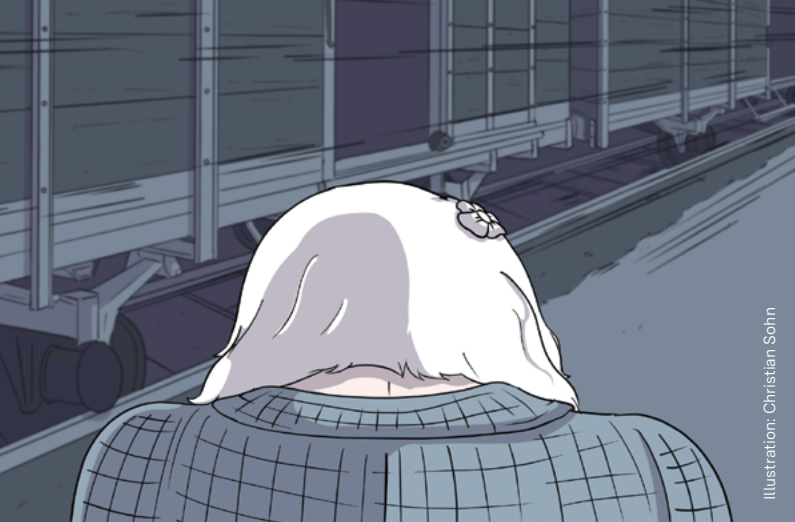
Illustration: Christian Sohn

Künstlerische Darstellung der Großmutter Christian Sohns in Gedenken an die Vertreibungen 1946